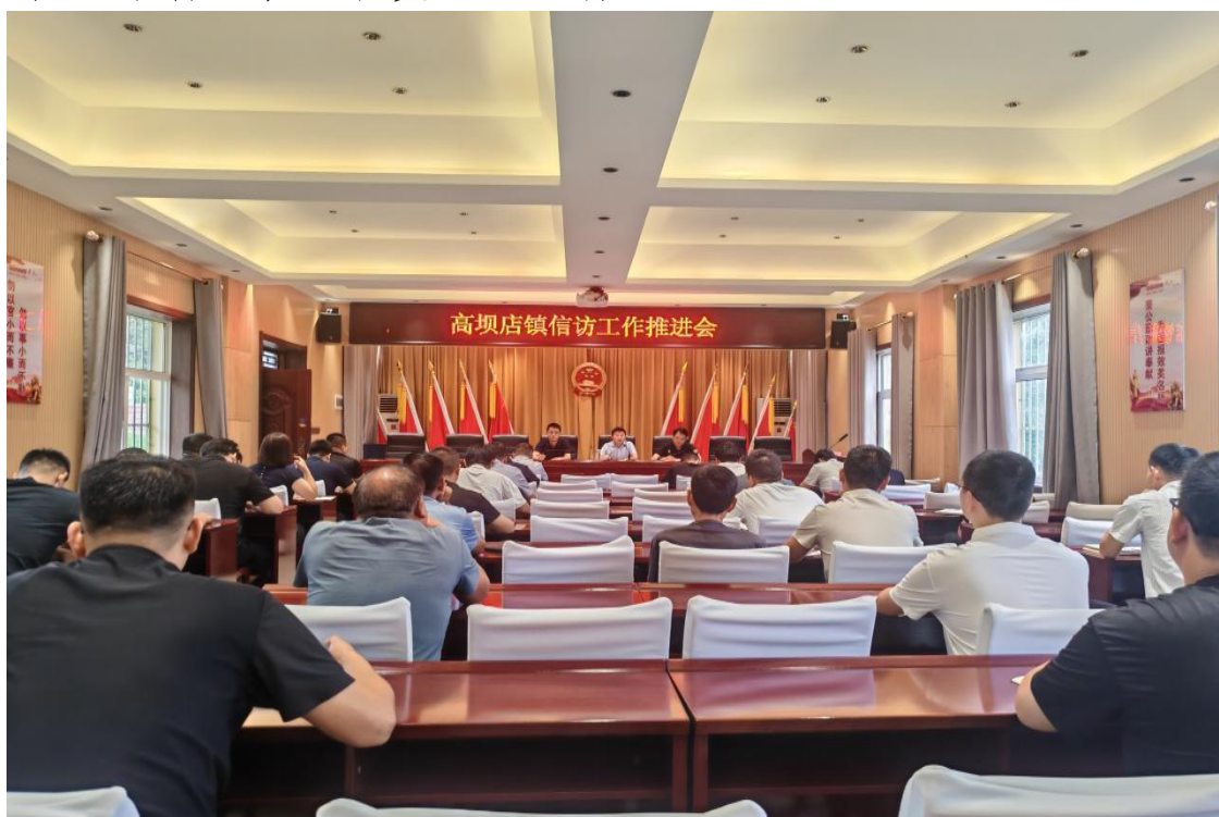
安排部署信访工作

法委员任副组长，各科级领导、镇属单位负责人为成员的网格化管理工作领导小组，定期召开研判会议，查缺补漏、固强补弱，压紧压实工作责任，有效提升了网格化管理运行的组织保障能力。二是发挥人才作用。全面探索“把党支部建在网格上”的党建引领模式，构建“镇党委一村党组织—网格党支部（党小组）—党员中心户”上下贯通闭环工作流程，以组织覆盖推进工作覆盖，吸纳优秀党员、“四好家庭”等社会各界力量参与网格化治理，充分发挥人才作用，为社会治理添砖加瓦。三是健全治理体系。实行科级领导包项目、党建指导员包支部、党员网格员包农户的“三包三促三提升”党员联心服务，围绕重大项目、移风易俗等重点工作组建24个工作队，下派22名党建指导员，整合400余名党员为网格员，有效将党的组织和工作有效嵌入各类治理主体。