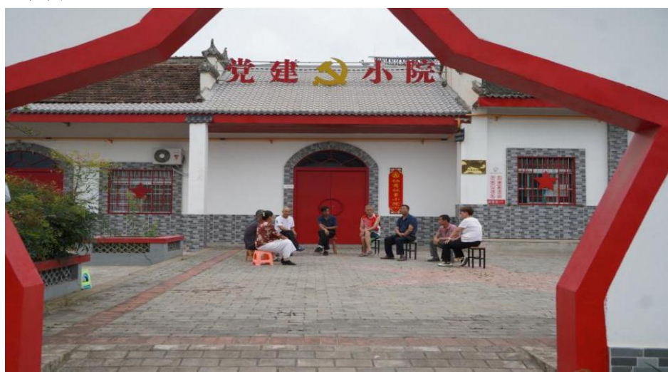
武屯街道老寨村“小院议事”

中采纳“门前绿化改菜园”建议，兼顾实用与美观。福美社区充电桩建设中，居民代表与供电公司、物业现场协商，建成16个充电位，解决“充电难”问题。三是专业力量“补位”不“越位”。针对专业问题引入外部支持。郑家村灌溉难题由专业人员两天内建成2口井，保障百余亩耕地用水，确保协商结果科学可行。