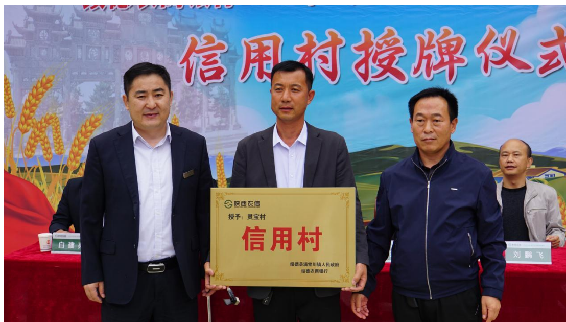
与绥德县农商行合作，对信用村授牌

积分评价体系，将乡村振兴的宏观要求转化为可量化、可操作的行为标准，为乡村治理提供了精细化、规范化的实施路径。一是聚焦“五大振兴”要求，制定村民积分扣分事项。设置积分项 72 项，扣分项 25 项，其中，产业振兴 17 项、人才振兴 9 项、文化振兴 18 项、生态振兴 13 项、组织振兴 15 项，让“五大振兴”与群众生产生活实际联系起来，做到好理解、可琢磨、有标准。二是聚焦担当作为好支书标准，制定村干部积分扣分事项。围绕基层党建、集体经济、乡村治理、人居环境等重点任务，设置积分项 16 项、扣分项 23 项，以积分树立风向标，提振村干部干事创业的精气神。三是聚焦镇村信用体系建设要点，制定行政村积分扣分事项。围绕金融系统关于信用村建设的考核指标，设置积分项和扣分项，共计 6 项，根据积分享受贷款审批等惠民政策，促进形成“知信、用信、守信”的良好风气。