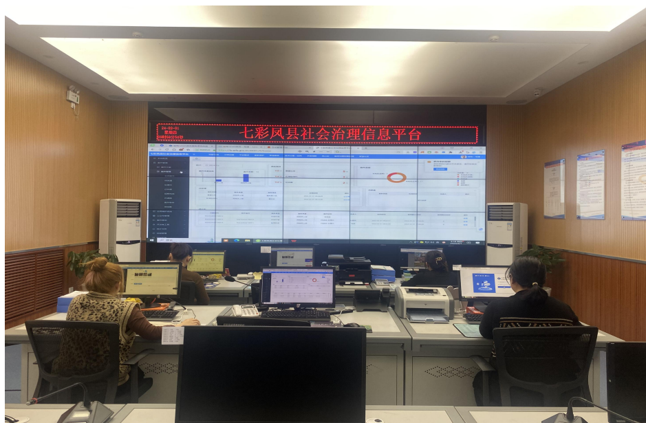
网格办工作人员正在受理派遣网格案件

题。结合县情实际量身定制“七彩凤县”APP和微信小程序，用于向群众宣传凤县党建、文明实践、平安建设等工作内容，并在群众展示页梳理添加了政务服务事项，群众可通过平台了解并办理相关业务。结合县域实际，凤县又创新性地将“秦岭生态保护”嵌入平台，网格员在巡护中发现的各类环境问题均可通过图文方式即时上报，形成了“人人都是秦岭生态卫士”的常态化监管机制。“七彩凤县”社会治理信息平台以党建为引领，通过系统贯通、信息支撑、数据驱动、流程再造，推动以数字化、网格化为手段的社会治理模式，将精细化理念和手段引入基层乡村治理的各个领域、各个环节，进行数字化、智慧化、精细化运作，使社会治理延伸到基层细枝末节，实现社会治理各要素精确、高效、协同、智慧、持续运行。