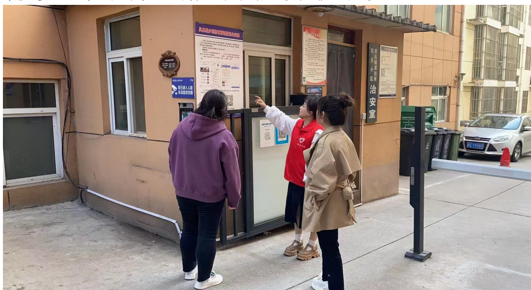
社区工作人员为群众介绍小区网格化便民公示牌

和电话。第一级，由下沉干部或中心户长为群主，建立基础群，群众有需求直接在群中反映，中心户长和下沉干部直接上报“七彩凤县”社会治理信息平台，中心交办、督办、反馈、评价，形成闭环管理；第二级，由责任单位主要领导为群主，建立协调群；第三级，由包抓网格的县级领导为群主，建立指挥群。三级微信群的建立，进一步拓宽了民意传达渠道，拉近了干部和群众的距离，居民在群里反映的路灯不亮、水管破裂等问题，常常在几小时内就能得到响应和解决。为了让信息传递更接地气，凤县还鼓励网格员用方言语音在群内解读政策、发布通知，这一贴心举措尤其受到了不熟悉普通话的老年群体的欢迎，切实提高了群众的幸福感和获得感。