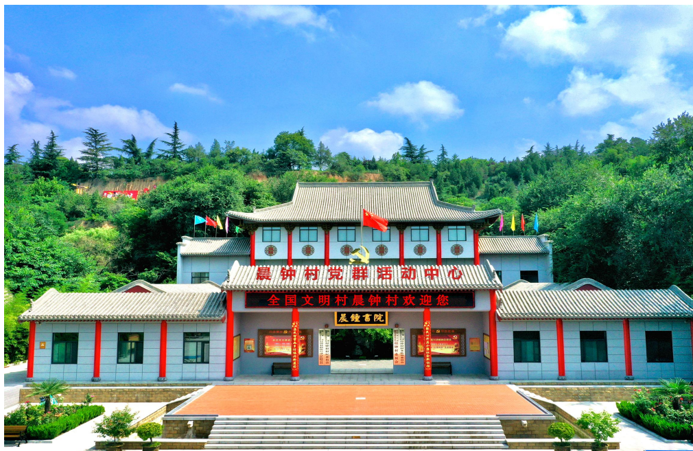
清理挂牌后的晨钟村党群服务中心

市、镇、村（社区）三级联动，集中整治村级组织“挂牌乱象”。以“坚决摘牌、规范挂牌，保留群众需要知晓的、定期拆除过时无效的、整合统一职权相近的牌子”为原则，梳理制定《村（社区）组织和党政群机构设立村（社区）工作机制挂牌指导目录》，以视频形式录制《规范指南》，明确挂牌清单，即村（社区）在综合服务设施外部显著位置悬挂党组织、村（居）民委员会、村集体经济组织、村（居）务监督委员会 4 块标牌，党群服务中心、新时代文明实践站 2 块标识。办公服务场所提倡一室多用，整合归并村（社区）办公服务场所内部功能性指示牌，坚决防止标牌标识由“外挂”往“内迁”。凡不涉及村（居）民知晓的内部制度、流程一律不上墙。对不规范、不实用的牌子制度予以清理。全市累计清理机构牌子 525 块。