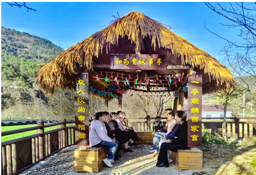
梭楞村议事会商议矛盾纠纷排查

（三）随时随地敞开聊，在哪议有温度。一是阵地延伸，场景融合。打造“流动议事点”“田间议事站”“线上议事厅”等议事微阵地，推动协商场景与生产生活深度融合。灵活运用主题化议事、情景化协商等方式，实现“农忙时节田间即时议、农闲时分院落集中议、外出人员云端同步议”，形成处处可议事、时时能协商的民主空间，让群众在家门口、在屏幕前都能便捷参与乡村治理。二是多方兼容，权益覆盖。针对不同议事事项的性质特点和参与主体的实际情况，精准匹配差异化议事形式。特别关注老年人、妇女、残疾人等群体的议事体验，通过简化流程、方言表达、上门议事等方式，切实保障其知情权、参与权、表达权、监督权，推动各类民生诉求无障碍表达、高效率响应、实质性解决。