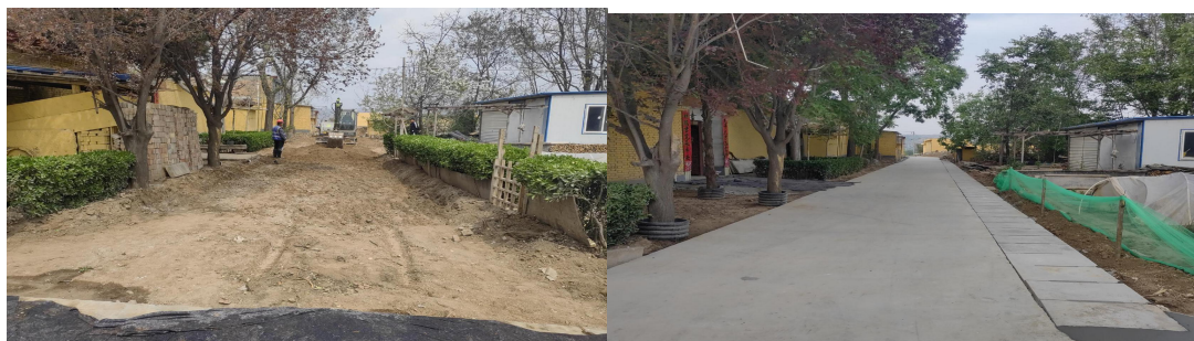
五星村道路硬化前

民情，及时回应诉求，有效链接资源，实现服务上门、帮扶到人。实施“民情连心大走访”活动。包村领导每月围绕所包抓村（社区）的重点产业、项目推进等情况开展实地走访；每季度对所包抓村（社区）困难群众、留守老人等特殊人群进行集中走访，掌握生活状况与实际困难；每年对包抓村（社区）所有群众进行遍访，确保走访全覆盖、联系不断线。通过走村入户、主动进门，变群众上访为干部下访，推动民情实况在走访中掌握、政策宣传在入户中落实、群众困难在沟通中解决、干群情谊在交往中加深。建立走访帮扶闭环机制。对走访收集到的问题，特别是涉及困难群体、特殊人群的诉求，建立“走访发现一问题梳理一精准帮扶一跟踪回访”的工作闭环。联合司法、民政、卫健、人社、公安等部门，对低保户、特困人员、孤寡老人、留守儿童、重点服务管理人员等群体开展定期走访，动态掌握其生活状况和实际困难。提供精准化救助服务。根据走访摸排情况，有针对性地提供民政救济、医疗救助、就业援助、法律援助、司法救助等多元化、个性化帮扶措施。确保各项惠民政策精准滴灌到需要帮助的群体，切实解决他们的急难愁盼问题，增强群众的归属感和幸福感。