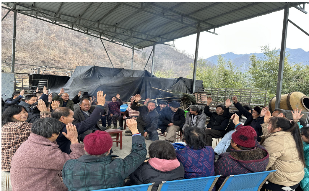
狮子坝村协商村集体养老补贴

（二）大家伙儿齐上阵，谁来议有力量。一是多元参与，聚智聚力。精心构建“1+5+X”多元议事架构，1个核心即：村党支部带领下的村民议事会；5类固定代表即：村“两委”成员、村监委成员、村民小组长、村民代表、老党员/老干部；X类灵活参与方即：利益相关方、“两代表一委员”、专家学者等，形成结构合理、覆盖广泛、梯队完整的议事人才储备体系。二是机制赋能，协商提质。根据议题内容、利益关联与影响范围精准匹配参与主体，对涉及多方利益的复杂事项，创新建立会前预沟通机制，提前凝聚共识、消解分歧。议事过程中，固定代表充分反映民意基础，利益相关方精准表达核心诉求，专业人士提供政策解读与技术支撑，形成民意、诉求、专业三维融合的协商格局，全面突破“政府单向主导”的传统治理模式，显著提升议事决策的科学性与执行认可度。