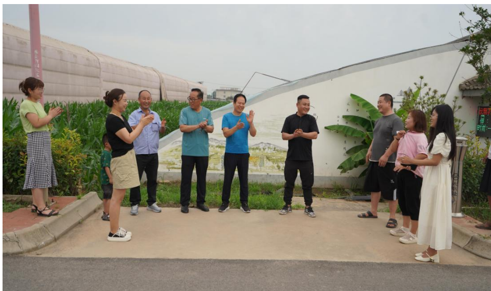
关山街道北冯村“瓜田议事”

灵活议事形式。关山街道北冯村在甜瓜大棚旁设立“瓜农说事”点，网格员、种植能手和收购商共同参与，现场化解灌溉、销路等分歧。仅关山街道就形成了“围炉煮茶”“枣园茶话”“议事长廊”等多个特色平台，群众在茶香、果香中敞开心扉，去年以来已化解邻里矛盾 120 余起。