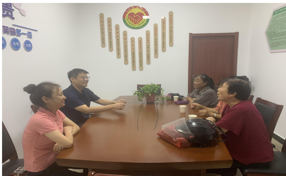
镇党委协调解决特殊群体养老诉求

培育多元化参与主体。积极孵化“红色乐家”志愿服务队，并根据不同群体特点，组建家庭普法“少年组”、护村维稳“青年组”、信息收集“巾帼组”、纠纷调解“银发组”等特色自治组织。广泛吸纳老党员、老干部、老教师以及人大代表、法律顾问、“百姓名嘴”等社会力量加入调解队伍，目前已培养“法律明白人”65名，形成了专兼结合、群防群治的调解工作格局。创新“四民工作法”激发自治活力。全面推行“民事民提、民事民议、民事民商、民事民评”工作方法。鼓励群众通过多种渠道提出关切事项；组织利益相关方和群众代表共同商议解决方案；在协商中寻求共识，形成处理意见；事后由群众对办理过程和结果评议监督，有效激发群众的主人翁意识，让群众成为基层治理的积极参与者和受益者，从源头上减少矛盾的产生。