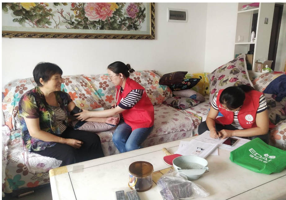
县医院开展志愿服务活动

和网格化建设基础，组建以下沉干部为主要组成成员的“红小凤”志愿品牌队伍；在七彩凤县公众号、小程序中添加志愿活动功能，群众可以通过自愿报名的形式成为志愿者并加入志愿者组织。按照“活动发布、招募志愿者、开展活动、成效展示”的流程常态化组织开展“红小凤”志愿服务活动。自志愿活动开展以来，全县共组建志愿队伍 514 支，招募志愿者 5242 名，围绕学习实践科学理论、宣传宣讲党的政策、培育践行主流价值、丰富群众文化生活、解决群众所需所求等形式开展活动 4125 次。下沉干部由解决群众急难愁盼问题转变为自愿志愿服务群众，引导群众积极参与到志愿服务体系当中，营造了“人人志愿、人人服务、人人共享”的良好氛围；凤县利用智慧化、信息化手段，搭建起政府与群众的“连心桥”，延伸了政府触角，及时补充行政力量短板，让广大群众在“红小凤”志愿服务活动中获得实际利益。