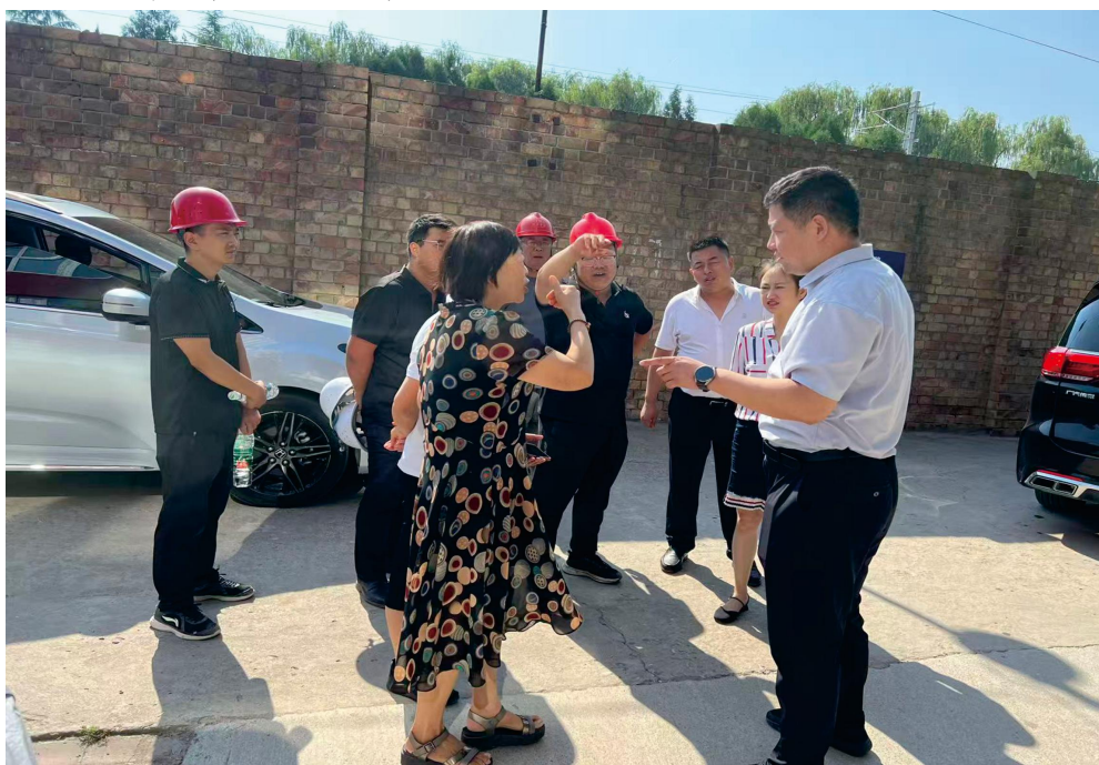
镇党委协调老旧小区改造相关事宜

人熟、地熟、事熟的优势，对邻里纠纷、家庭矛盾等日常“小事”进行随手调、现场办；对涉及面广、专业性强的“难事”，及时上报并协同相关力量综合调、联合办，切实将风险隐患消除在萌芽状态，筑牢基层稳定的第一道防线。