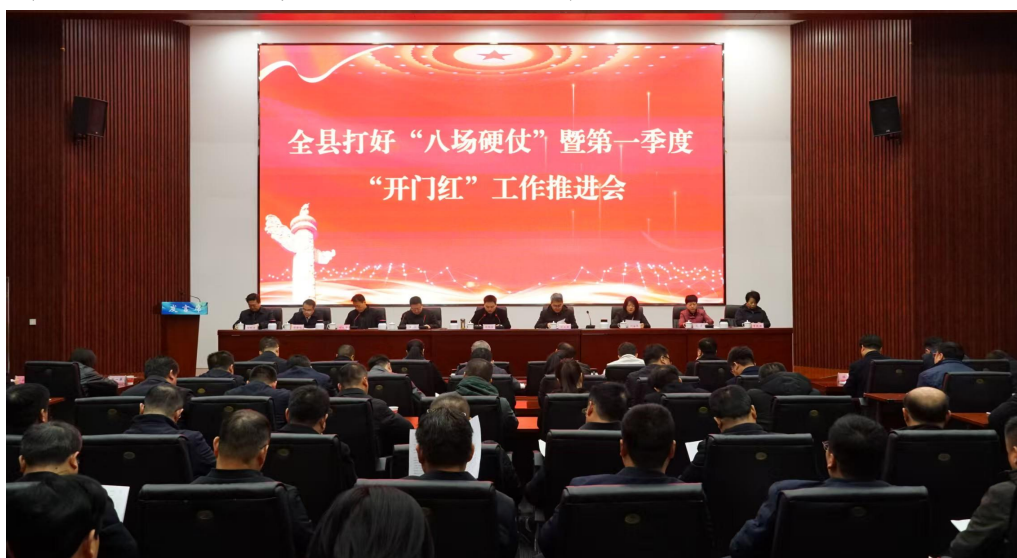
八场硬仗暨一季度开门红工作推进会

（三）广泛动员激活力。迅速启动“巡诊家家到”行动，3月5日，在全县打好八场硬仗暨一季度开门红工作推进会上专题动员部署。全县9个街镇、29个参与部门、2个平台公司第一时间明确单位主要负责人牵头“巡诊家家到”工作领导小组，组织中坚力量投身“巡诊家家到”行动。行动开展以来，全县260余名科级领导、1100余名镇村和部门干部积极投入到行动中，为基层巡诊提供了坚强的力量保障。