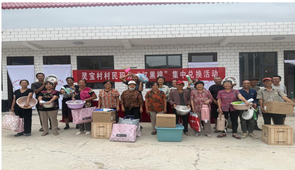
每月定期开展集中兑换活动