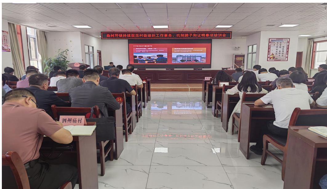
开展村级减负专题培训

效率提上去。二是过程管控纠偏。在全市范围内选取 12 个村（社区）作为观察点，设置 5 个由市级工作人员负责的观察哨，将村级工作事务、机制牌子和证明事项等作为主要内容，切实发挥点位预警作用，时刻关注新动向、新表现、新问题。对于发现的涉及范围广、频次高、村（社区）和群众反映强烈的事项，逐一反馈至各部门，督促及时纠偏、优化流程。组建专项督导组，采取“四不两直”的方法，对村级组织工作开展情况进行督帮。组织召开减负督办会，对存在问题进行通报，督促整改。逐镇（街道）开展专题培训，推动工作有序落实。