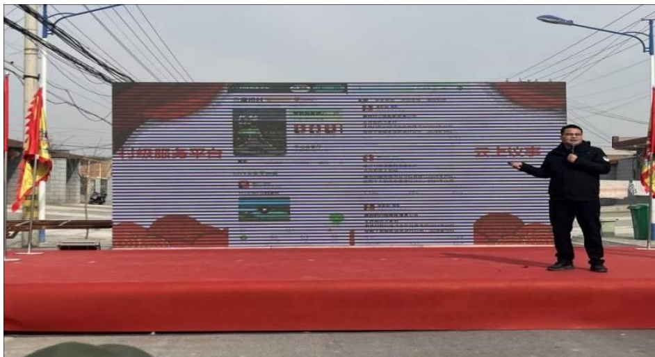
向村民介绍“云上议事”