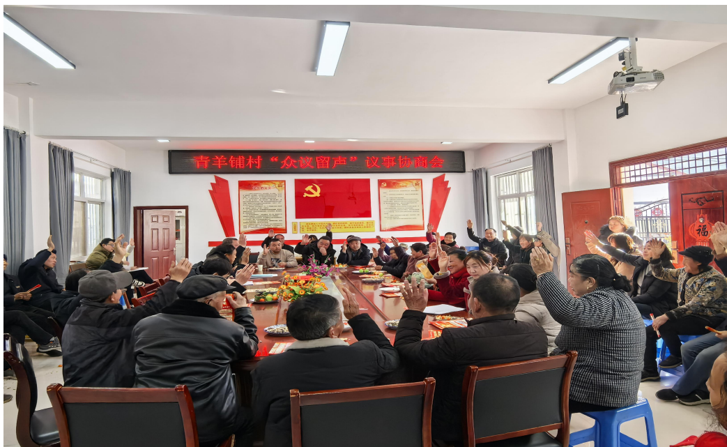
青羊铺村协商“德美屋”管理制度

（一）支部牵头定盘子，议什么有方向。一是清单定界，议事有章。制定《留坝县推行“众议留声”规范村（社区）议事协商机制的工作方案》，系统构建“法定、重大、一般”三类30项刚性议事清单，明确界定不得纳入议事协商的4大类事项范围，清晰划定“必须议”的责任领域，标注“不能议”的纪律红线，推动议事协商从“随意发起”转向“规范运行”。二是组织把关，引领有方。充分发挥村党支部在议事协商中的“主心骨”作用，全程负责议题征集筛选、会议组织协调、流程规范引导与决议执行监督，确保议事主题不偏移、协商过程不走样、决议落实不打折。通过清单管理与组织把关的有机结合，既有效防范了程序性风险，又为群众参与提供了清晰指引，议事质量与决策公信力得到同步提升。